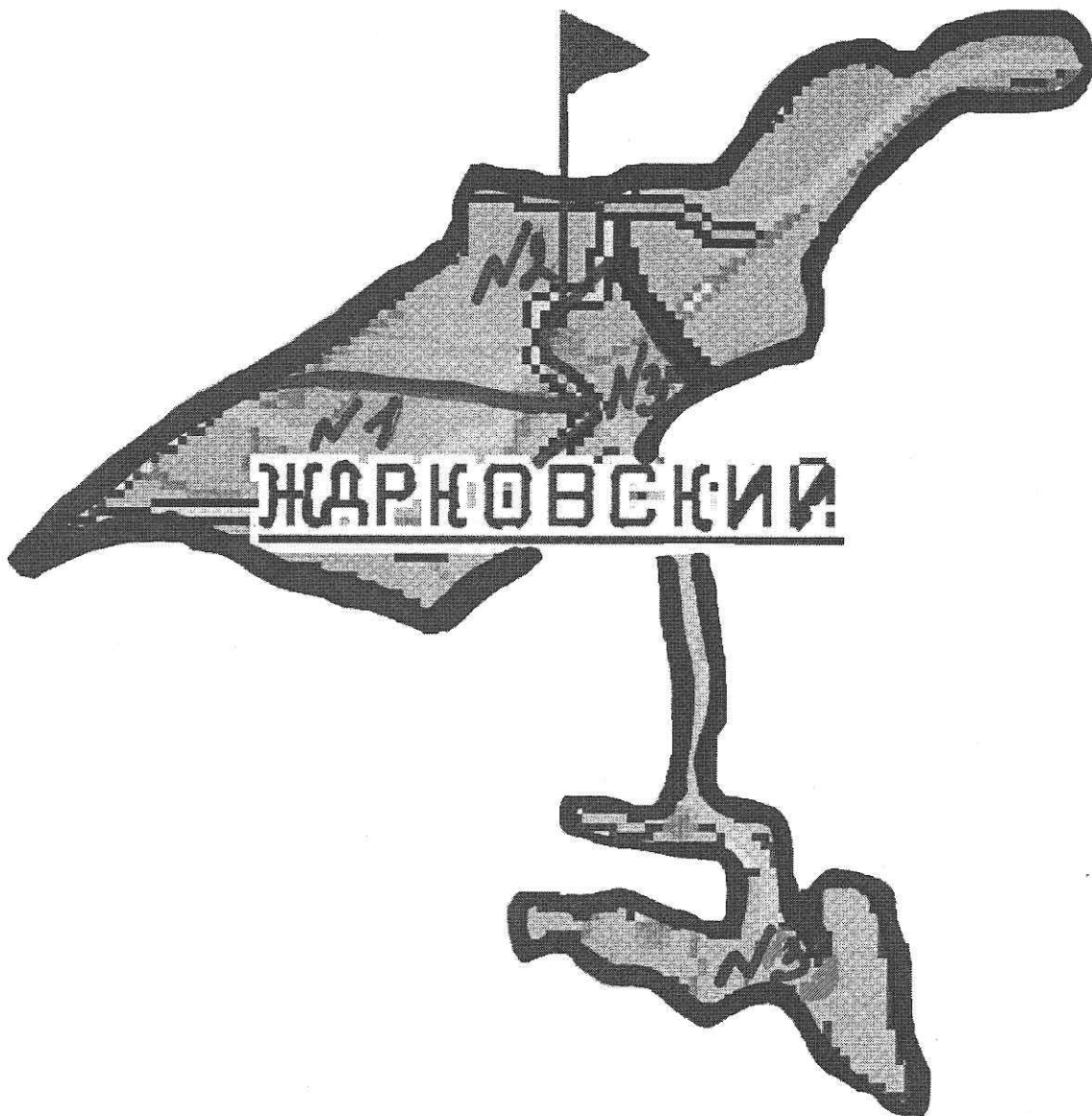
схема многомандатных (3-х и 4-х мандатных) избирательных округов для проведения выборов депутатов Совета депутатов городского поселения – пос. Жарковский в сентябре 2018г.