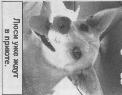
Люси уже ждёт в приюте.

Люси, дворняжка из Нелидово, потерявшая человека, нашла приют в специализированном московском благотворительном фонде. Напомним: Люси, предположительно, сбросил с балкона её хозяин ( подробности читайте на сайте kp.ru ). Собака получила перелом по-